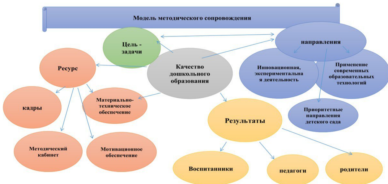
Рисунок 2. Модель методического сопровождения ДС № 106 «Изюминка» В 2025г. детский сад укомплектован педагогами в количестве 14 человек.

В течение отчетного периода с целью повышения качества дошкольного образования, в детском саду функционировала Модель методического сопровождения педагогов детского сада с учетом их качественно-количественного состава (рис.2).